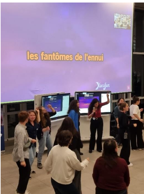
Karaoke samedi soir