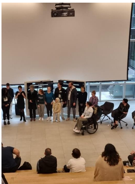
Cérémonie de remise des bourses