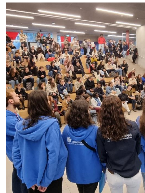
Discours de clôture